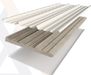
■ Glamet LV