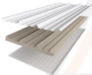
■ Glamet A-42